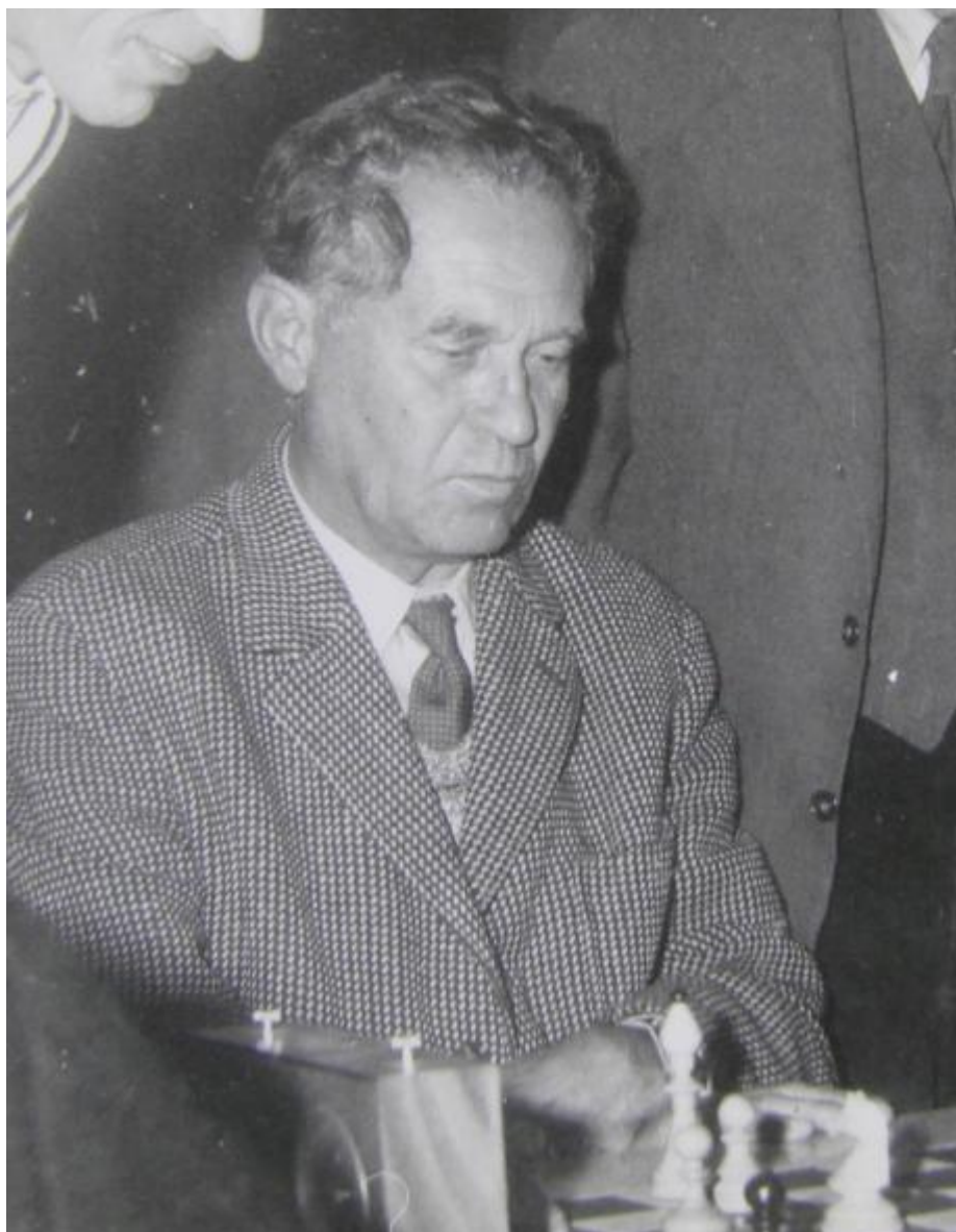
(Jan Šedý – z archivu JK)